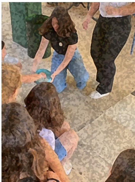
Μη Νευτώνιο ρευστό