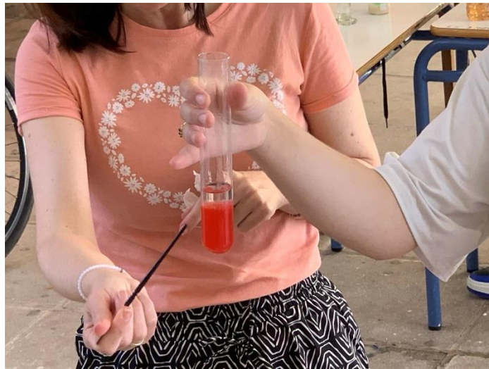
Απομόνωση DNA από φράουλα