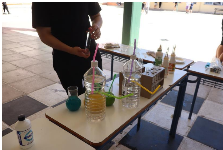
Πείραμα βασισμένο στην αρχή του Pascal